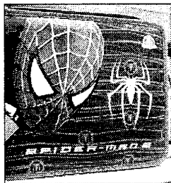
L'ASTUCCIO DI SPIDER MAN COSTA INTORNO AI 20 EURO