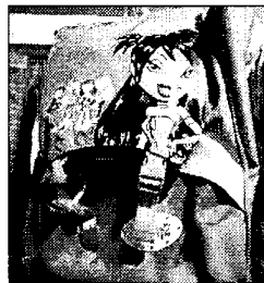
LO ZAINO DELLE BRATZ VARIA DAI 40 AI 55 EURO