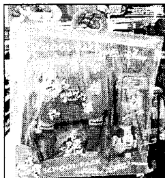
KIT SCUOLA DISNEY A 34,90 EURO ALLA UPIM